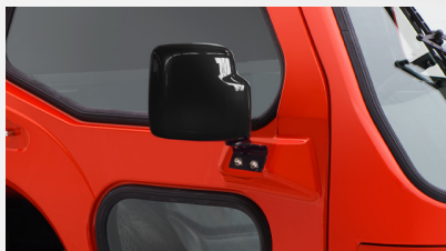
ワイドになったサイドミラー