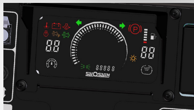
暗い時間帯でも視認性に優れ一目でわかる LEDコンビネーションメーター採用