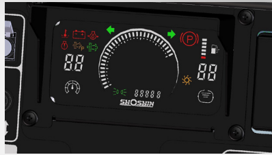
暗い時間帯でも視認性に優れ一目でわかる LED コンビネーションメーター採用