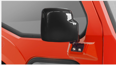
ワイドになったサイドミラー